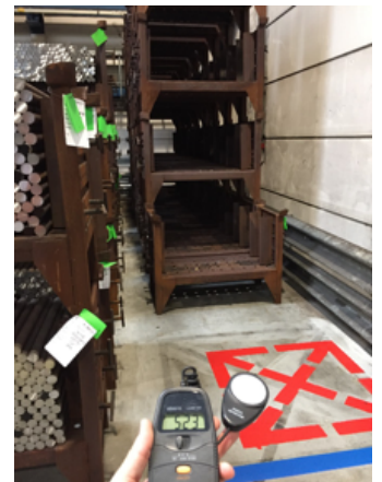
Op bepaalde plaatsen van 90lux naar 500lux