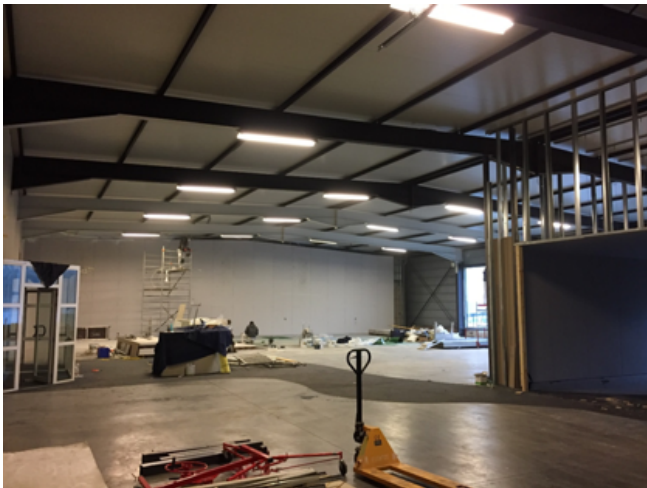
Oude situatie (TL lampen)