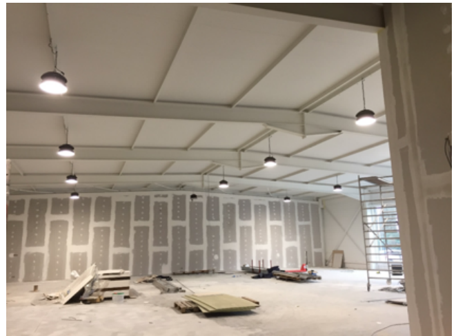
Nieuwe situatie (High Bay Led EL S-HBL-1804)